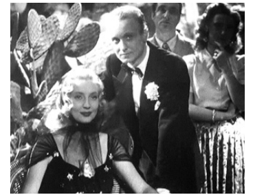
1944 L'ÎLE D'AMOUR de Maurice Cam avec Josseline Gaël