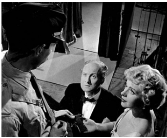
1954 UNE BALLE SUFFIT (La canción del penal) de Jean Sacha & Juan Lladó avec Véra Norman