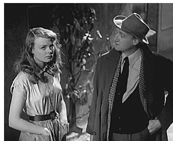
1952 L'ENVERS DU PARADIS d'Edmond T. Gréville avec Etchika Choureau