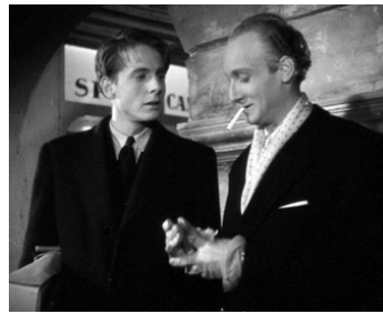
1942 LE VOYAGEUR DE LA TOUSSAINT de Louis Daquin avec Jean Desailly