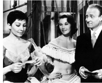
1956 FOLIES-BERGÈRES d'Henri Decoin avec Zizi Jeanmaire, Nadine Tallier