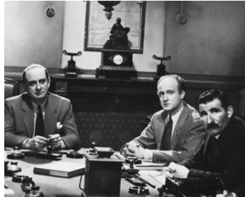
1950 JUSTICE EST FAITE d'André Cayatte avec Jean Debucourt, Marcel Pérès