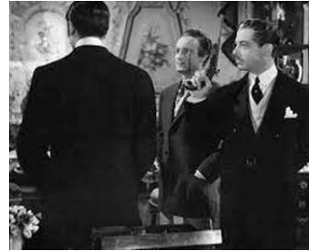
1947 CAPITAINE BLOMET d'Andrée Feix avec Fernand Gravey