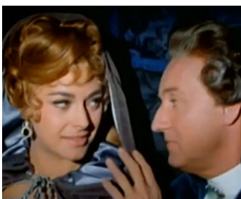
1966 LE CHEVALIER À LA ROSE ROUGE (Rose rosse per Angelica) de Steno avec Raffaella Carra