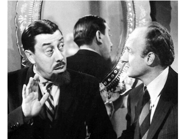
1950 TOPAZE de Marcel Pagnol avec Fernandel