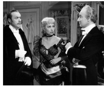
1954 NANA de Christian-Jaque avec Charles Boyer, Martine Carol