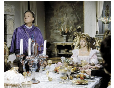
1964 ANGÉLIQUE, MARQUISE DES ANGES de Bernard Borderie avec Michèle Mercier