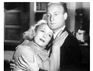
1954 AVANT LE DÉLUGE d'André Cayatte avec Isa Miranda