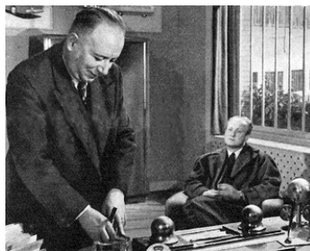
1952 LES AMOURS FINISSENT À L'AUBE d'Henri Calef avec Louis Seigner