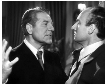
1951 VICTOR de Claude Heymann avec Jean Gabin