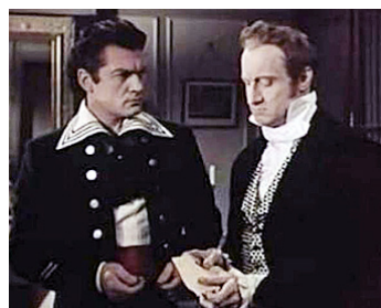
1954 LE COMTE DE MONTE-CRISTO de Robert Vernay avec Jean Marais