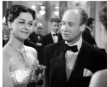
1951 LA VÉRITÉ SUR BÉBÉ DONGE d'Henri Decoin avec Juliette Faber, Danielle Darrieux