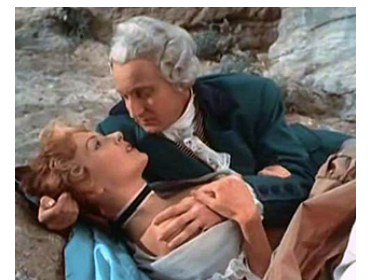
1953 LES RÉVOLTÉS DE LOMANACH de Richard Pottier avec Dany Robin