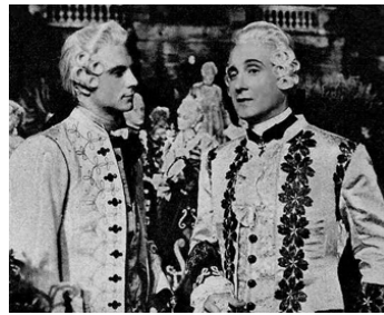
1954 LES DEUX ORPHELINES (Le due Orfanelle) de Giacomo Gentilomo avec Franco Interlenghi