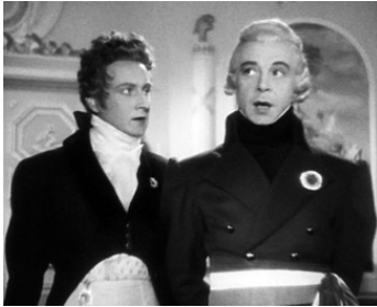
1944 PAMÉLA de Pierre de Hérain avec Fernand Gravey