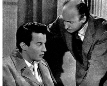
1950 PAS DE PITIÉ POUR LES FEMMES de Christian Stengel avec Michel Auclair