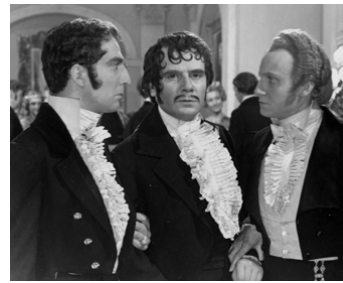
1944 LES ENFANTS DU PARADIS de Marcel Carné avec Marcel Herrand