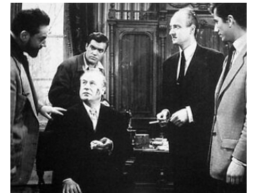
1951 LES MAINS SALES de Fernand Rivers avec P. Brasseur, Marcel André, Daniel Gélin