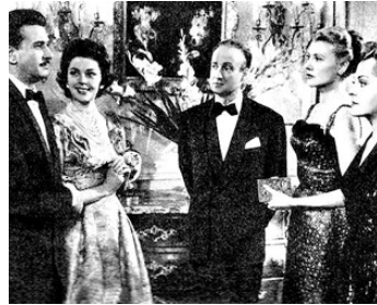
1955 SOUPÇONS de Pierre Billon avec Franck Villard, Anne Vernon