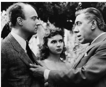
1952 LE FRUIT DÉFENDU d'Henri Verneuil avec Françoise Arnoul, Fernandel