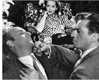
1947 ROUTE SANS ISSUE de Jean Stelli avec Hélène Perdrière, Claude Dauphin