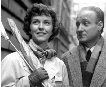
1955 RENCONTRES À PARIS de Georges Lampin avec Betsy Blair